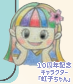
10周年記念 キャラクター 「虹子ちゃん」